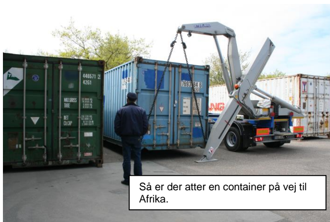
Så er der atter en container på vej til Afrika.

Denne opgave er rigtig god, for den giver eleverne mulighed for at stifte bekendtskab med forskellige brancher. Det giver også mulighed for at snuse lidt til handicapsektoren, cykelreparation, transport, lager, logistik og få teknisk snilde inden for elektroniske og mekaniske effekter. En anden vigtig opgave er at skrotte effekter, sikre en optimal skrotning af effekterne, som ikke kan bruges mere eller ikke kan repareres. Her sonderer vi mellem brandbart og ikke brandbart materiale, opdeling af metaller, batterier mv.